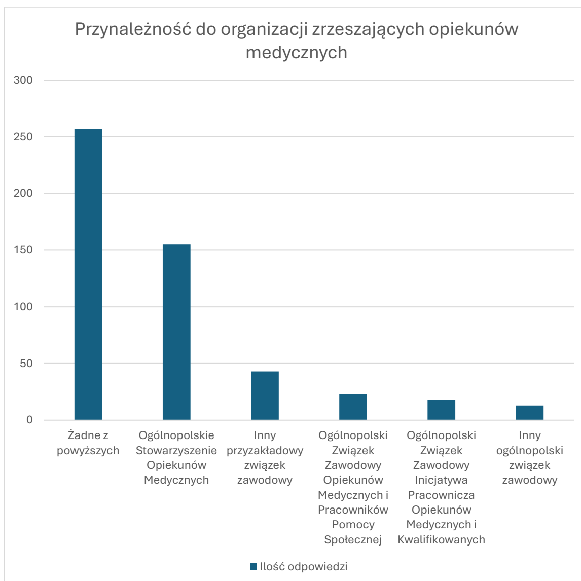
Wykres 4. Przynależność do organizacji zrzeszających opiekunów medycznych