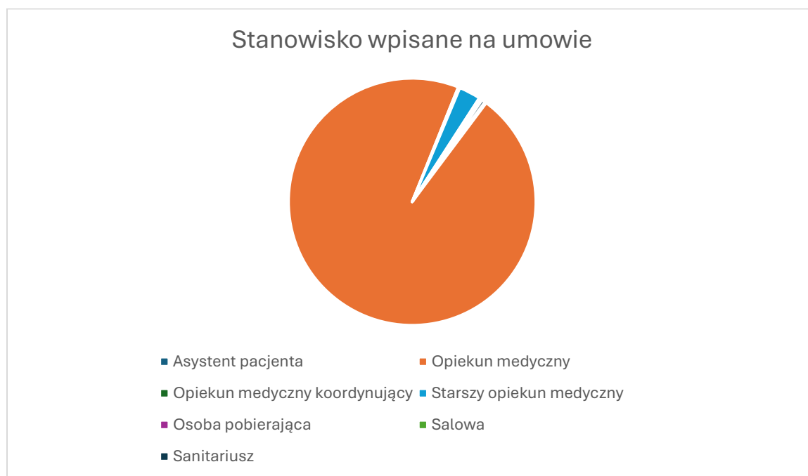
Wykres 1. Stanowiska na których osoby wykonują czynności opiekuna medycznego